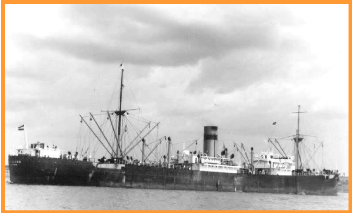
Stoomschip, gebouwd in 1920. Gewicht: 8156 ton. Afmetingen: 143,3 x 18,7 x 9,8 m. Motor: 2x stoom turbine, selheid: 13 knopen. Verlies op 28 februari 1941. Herkomst foto onbekend.

kreeg het twee zware luchtaanvallen te verduren van Duitse Focke Wulf vliegtuigen. Veel bemanningsleden vonden de dood, maar Jor overleefde.